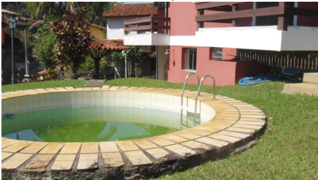
Piscina da FRAÇÃO B-13