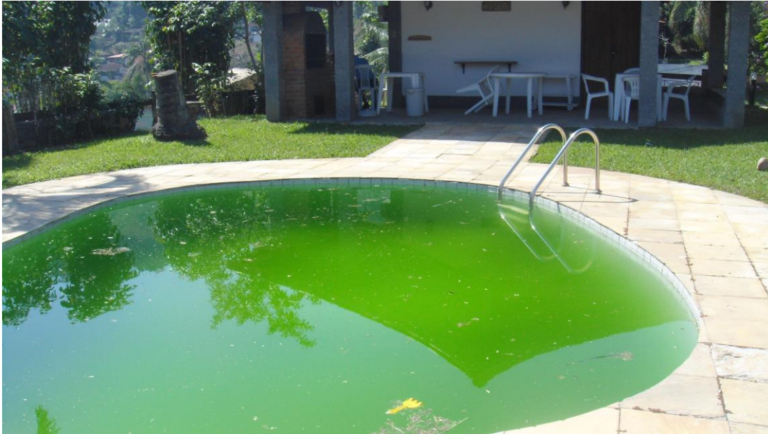
Piscina da FRAÇÃO B-12