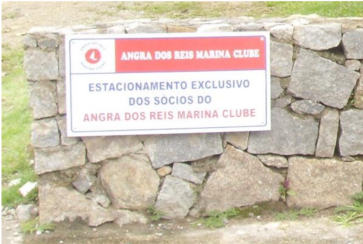
FOTO 03 – CHUMBADORES RECUPERADOS PARA INTALAÇÃO DA PLACA DE ESTACIONAMENTO DE USO COMUM (FOTO 01)